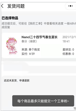
▲页面显示“每个商品最多只能提交一个工单”