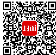
扫描二维码 可进行投诉