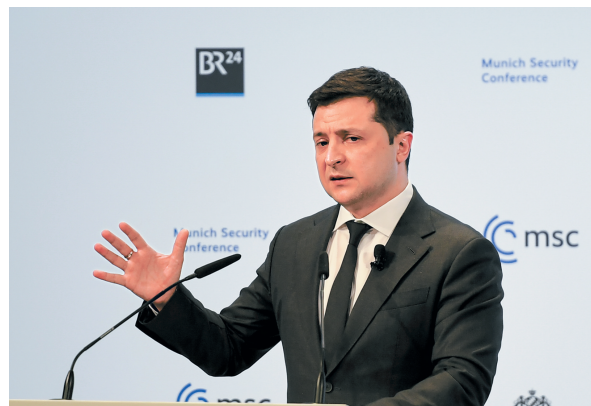
乌克兰总统泽连斯基