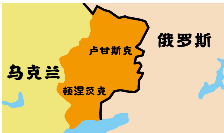
俄罗斯、乌克兰地理位置示意图。制图 杨仕成

普京随后在克里姆林宫与这两个俄方所承认“共和国”的领导人会面，并与他们分别签署友好合作互助条约。