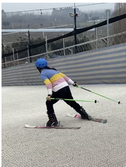
听障滑雪队队员在早雪场上驰骋。

比赛时有些不适应,加上经验不足,比赛时鞋子撞到了滑板,“我当时脑子里只有一个念头,不能放弃,要冲到终点!”回忆起那场比赛,他仍有些雀跃。