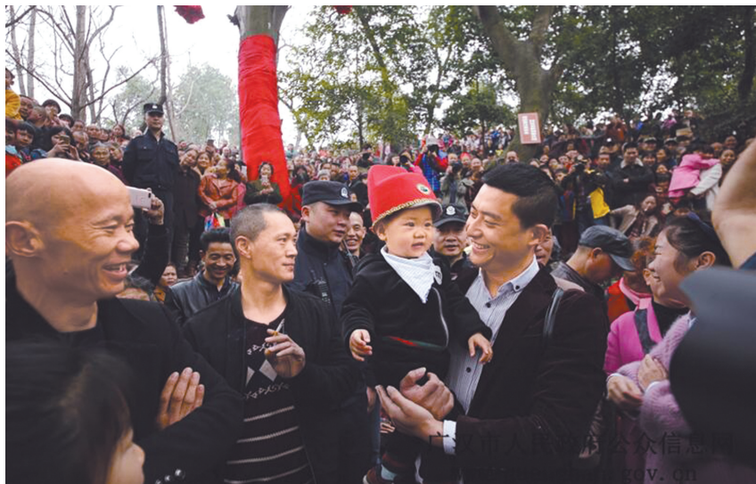
2018年广汉保保节现场。