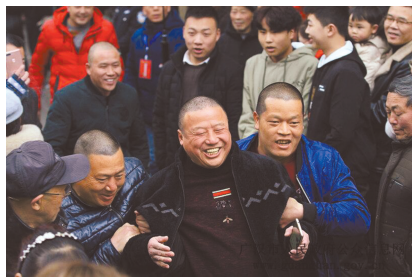
2019年广汉保保节现场。

是下雨，准备拉干爹的父母事先要把酒肉、香烛备好，用竹篮提着或者背篋背着，一大早就从四面八方赶到金花桥的桥头上。”刘孝昌回忆，大约上午十点左右，桥上已站满了一群群穿着新衣、新鞋，戴新帽的娃娃们，娃娃的父母与来帮忙的叔叔伯伯及舅舅们一起，四处举目张望，等适合当干爹作保保的上桥来。