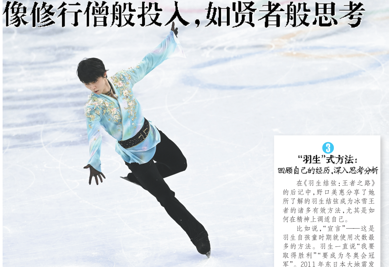
2月10日，日本选手羽生结弦在北京冬奥会比赛中。

2月10日上午，北京冬奥会花样滑冰男子单人滑自由滑项目比赛在北京首都体育馆举行。万众瞩目的明星选手羽生结弦取得第四名，未能卫冕。他在比赛中挑战此前还没有运动员在正式比赛中完成过的阿克塞尔四周跳(4A)，可惜最后落地不稳。