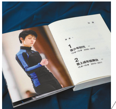
书中配图