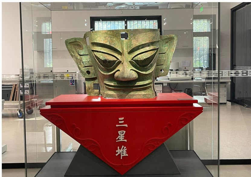
“回家”的青铜大面具在三星堆博物馆文物保护与修复馆内与公众见面。

元宵节当天，青铜大面具“回家”，在三星堆博物馆文物保护与修复馆首次与游客见面，低反玻璃展柜中的大面具，无比威仪，吸引了不少游客驻足观看。据了解，此次展出是为响应广大游客观展需求的临时性展出。下一步，三星堆博物馆还将联合国内一流的技术团队，进一步开展青铜大面具的修复、研究工作。