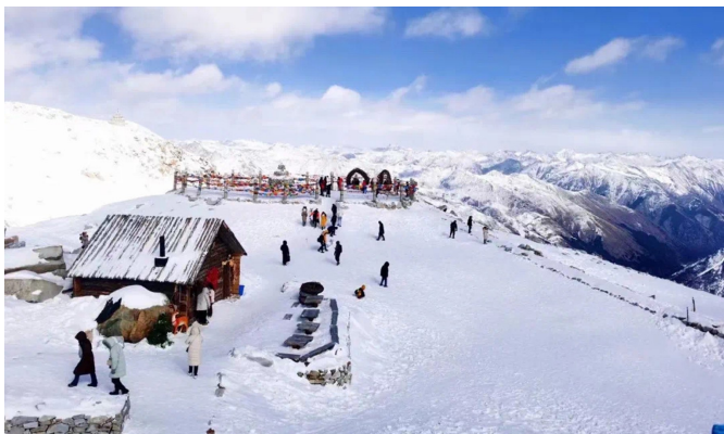
▲泸州叙永罗汉林吸引众多游客前来赏雪、玩雪。