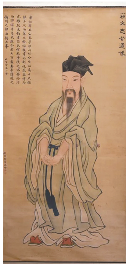
清余集《苏文忠公遗像》 三苏祠博物馆藏

“吾家东坡——苏轼题材文物特展·《苏轼书法全集》(四十五册本)图录特展”就是以该项目为依托,集中展示