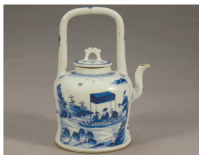
清雍正青花题赤壁赋诗提梁壶 故宫博物院藏

到三苏祠游玩的游客,都想看到与三苏相关的珍贵文物。遗憾的是,过去由于缺乏展陈条件,三苏祠近万件馆藏文物基本上是“锁在深闺人不识”。去年底,三苏祠式苏轩文物库房、展厅改造提升工程项目顺利完工。以本次展览为