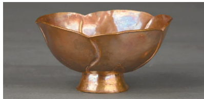
南宋五曲金盏 彭州市文物保护管理所藏