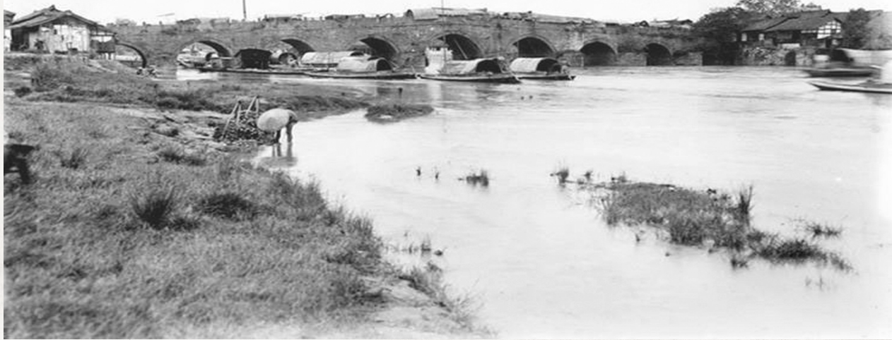
英国植物学家欧内斯特·亨利·威尔逊1908年拍摄的成都九眼桥老照片。

成都，一座因水而生的西南大都市，过去曾有“长似江南好风景，画船来去碧波中”的水乡风貌。那时，河流横贯，水桥共生，桥和水构成了老成都的锦绣风光，正如唐代大诗人刘禹锡《浪淘沙》中所描述：“濯锦江边两岸花，春风吹浪正淘沙”。在成都人的记忆中，成都又仿佛一座建在桥上的城市，清末民初，成都有名可考、有址可寻的大大小的桥有近200座。