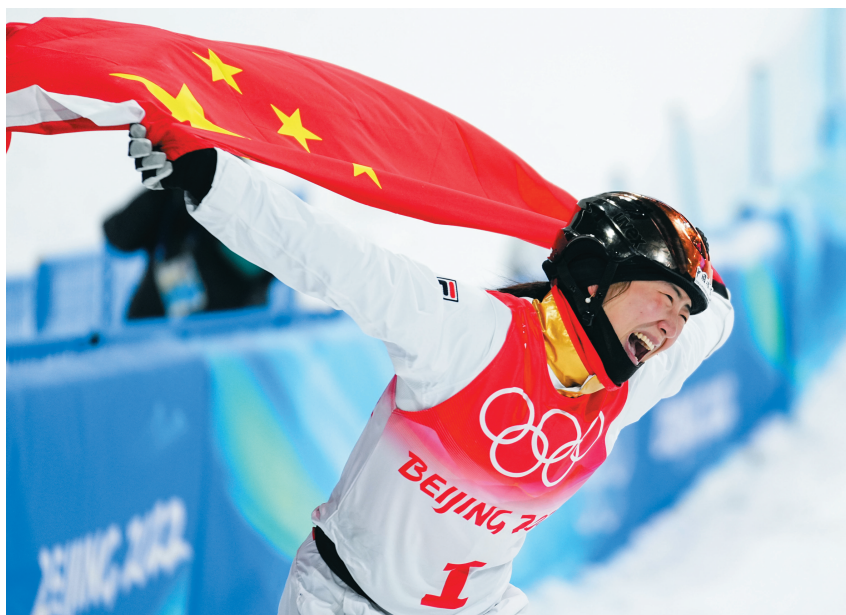
徐梦桃夺冠后激情庆祝。