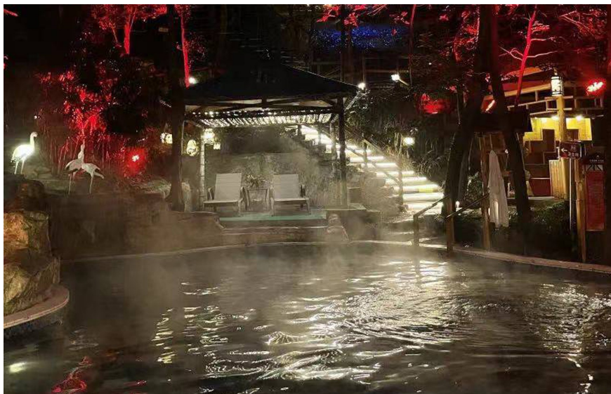
峨眉山红珠山森林温泉。