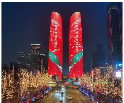
天府双塔亮出“成都萨博潘友谊长存”字样。

成都与墨西哥萨博潘于2015年10月建立友好城市关系。7年来,两市在文化、教育、经贸等领域开展了一系列友好交流与合作。为庆祝中墨建交50周年,