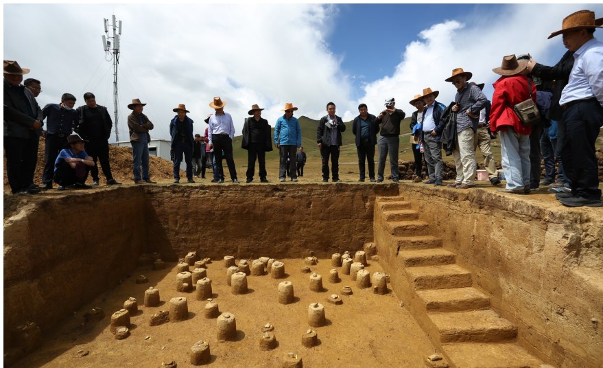
皮洛遗址发掘现场。(资料图)

三星堆遗址祭祀区考古发掘是国家文物局“考古中国”重大项目《川渝地区文明进程研究》的实施内容之一。从2020年3月启动发掘至今，已初步摸清祭祀区的分布范围和内部格局，并新发现6个“祭祀坑”，目前已基本全部结束发掘工作。此次发掘由四川省文物考古研究院联合以中国社会科学院考古研究所、北京大学考古文博学院为代表的国内39家科研机构、大学院校以及科技公司共同开展，秉持“课题预设、保护同步、多学科融合、多团队合作”的工作理念，展开考古发掘、文物保护和多学科研究等工作。截至目前，6个新发现“祭祀坑”已出土编号文物上万件，而近完整器超过2400件，其中