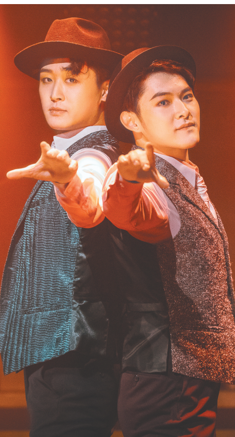
环境音乐剧《阿波罗尼亚》剧照。

地。如今的百老汇已是拥有几十家能容纳500人以上剧场的街区,是纽约文化生活特别是演出文化生活最聚集的区域,每年吸引着全世界的剧迷前去打卡。而伦敦的剧场文化更是要追溯到莎士比亚时期。