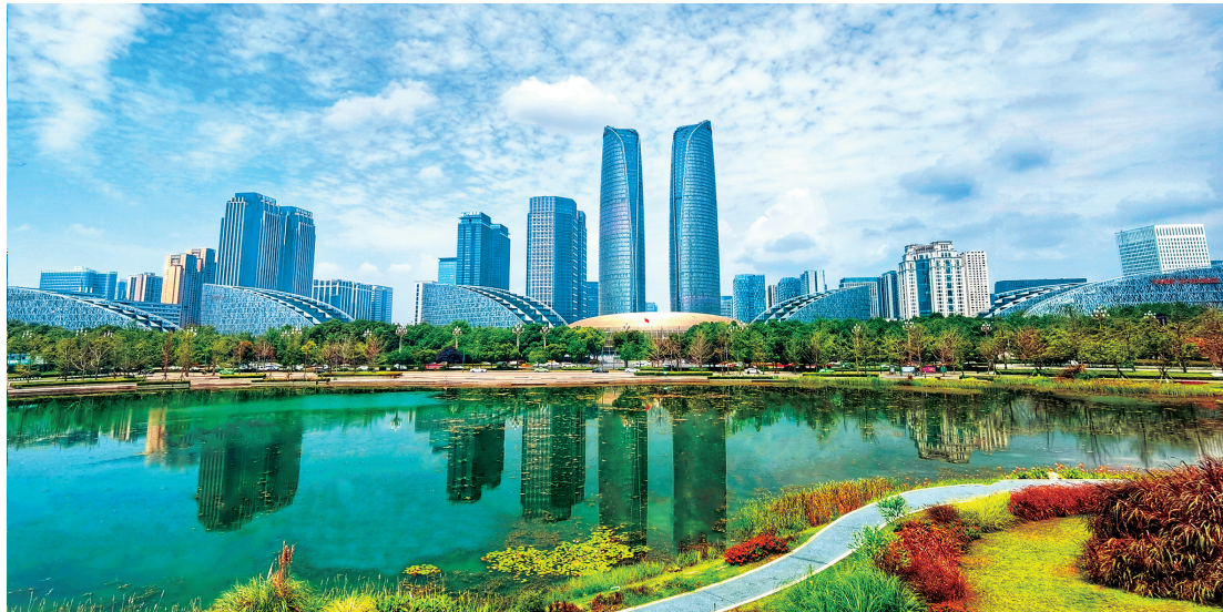
成都新经济活力区。

“打造具有全球影响力、竞争力的世界级机场群和国际航空枢纽，对于引领区域经济社会发展和产业转型升级，支撑成渝世界级城市群的建设具有重要意义。”四川省政协委员、四川省省委政