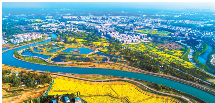
三道堰水乡航拍图。

企业的注册数量也在快速增长。天眼查数据显示，成渝地区双城经济圈2020年提出以来，截至目前，该区域新增注册企业达269万家，企业数量排名前三的城市分别为成都、重庆、绵阳，宜宾、眉山、南充则紧随其后。