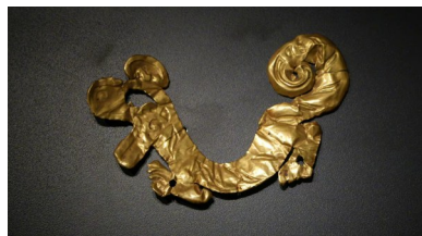
金沙遗址出土的石虎、青铜虎，以及三星堆出土的金箔虎(从上至下)。

吉尔的《琥珀》一文。当蜘蛛准备捕食苍蝇时，被一颗硕大的树脂包裹，最后，滚落在地的树脂球经过沧海桑田的沉淀，变成了一颗琥珀。