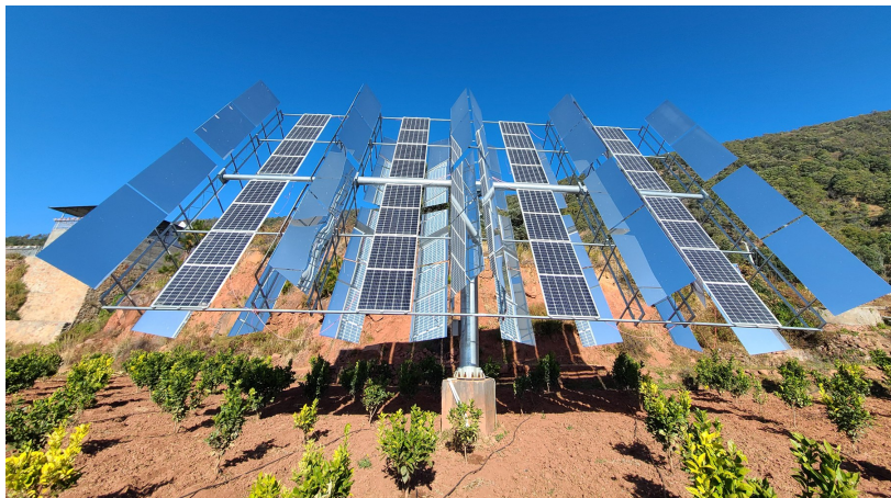
波西村的光伏发电项目。

“天天大太阳,晒得人焦躁得很。”冯加荣感慨,没想到以前被村民“嫌弃”的阳光,如今成了可以卖钱的