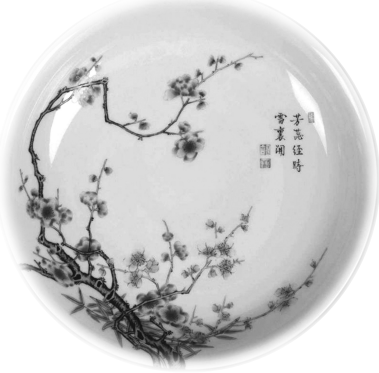
古月轩“梅花纹盘” (东京国立博物馆藏)

该书日文原版由日本权威NHK出版公司于2014年出版,是21世纪以来外国研究中国文物海外流失的一部重要学术论著。作者富田升历经千辛万苦寻找到当年中国古董交易方面的信息,填补了学界研究的空白,极其珍贵。这些史料是唯有“当事人”“当时人”才可能知晓的实情,是洞察事件本质的重要证言。