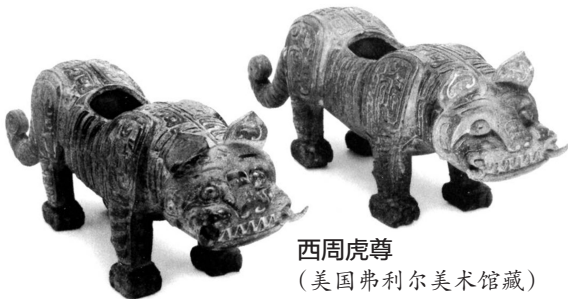
西周虎尊 (美国弗利尔美术馆藏)

日本历史学者富田升撰写的《近代国宝海外流失录》近日由中国画报出版社出版。该书从一位日本学者的角度,考证了清代末年中国文物是如何外流到世界,以及文物外流如何影响了流入国的传统审美意识,又如何参与了传统审美意识的近代化转型。