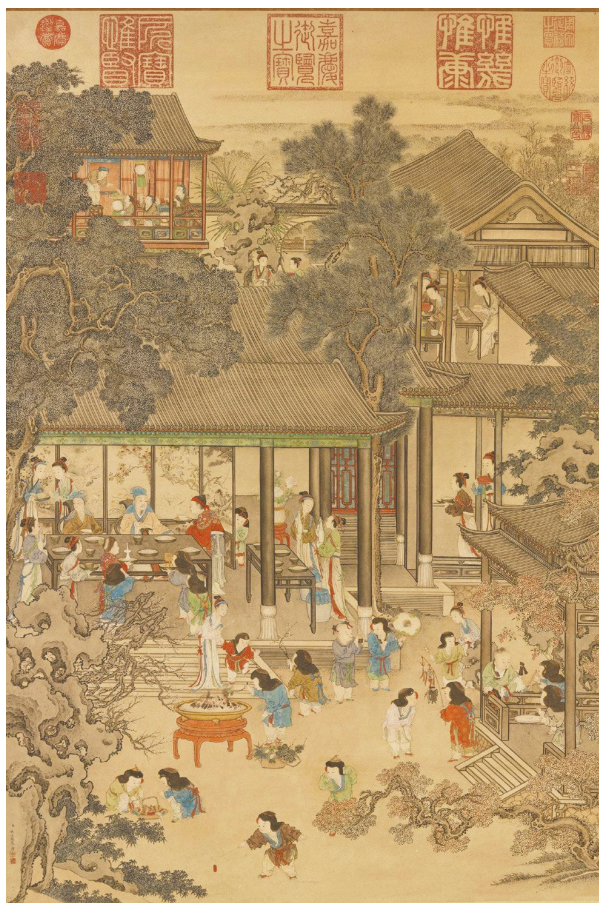
清 姚文瀚《岁朝欢庆图》。