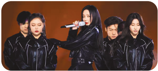
张靓颖演唱英雄联盟S7全球总决赛主题曲《Legends Never Die》。