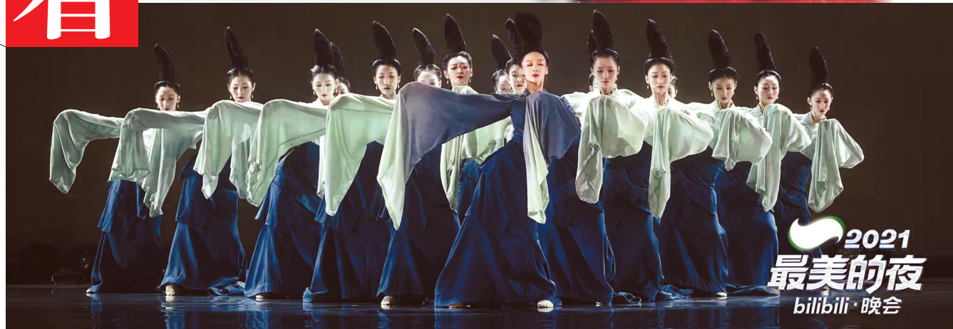
2021 最美的夜 bilibili·晚会