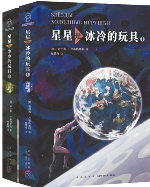
《星星是冰冷的玩具》