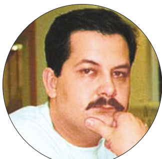
谢尔盖·卢基扬年科