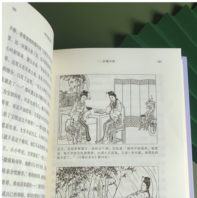
书中将经典名著与连环画相结合进行精彩阐述。