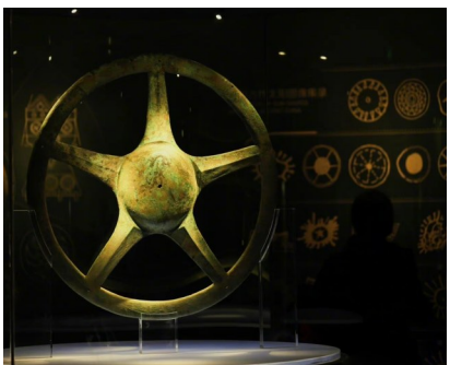
三星堆出土的青铜太阳轮。

传诵千年的“史上最强教材”。最早的“后蜀石经”为五代时期后蜀宰相毋昭裔主持刊刻的儒家经典石经，立于文翁石室，为学子们研读摹拓。毋昭裔之后，宋人续刻，最终历时近200年，集结了儒家十三经，奠定了儒家经典十三经的格局。蜀石经不仅刊刻经文，最为珍贵的一点是还刻有注释。它更以拓印本的形式影响全国，在宋代广为流传。