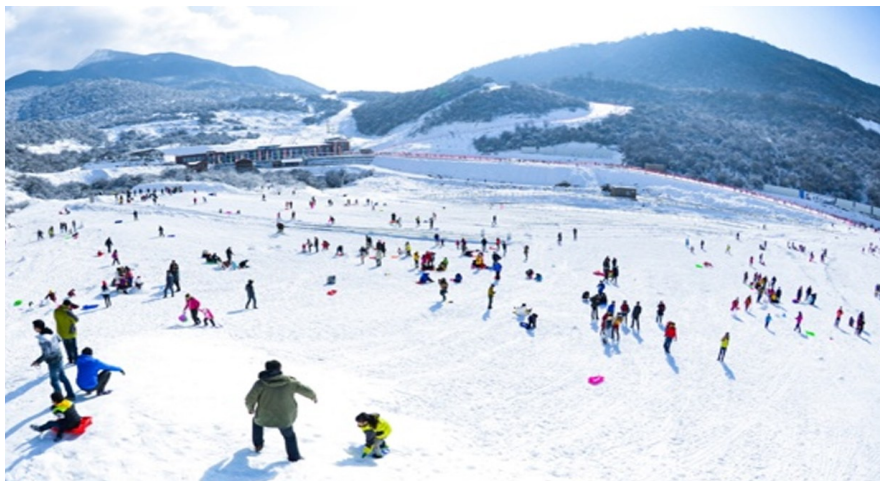
阿坝州九鼎山太子岭滑雪场吸引众多滑雪爱好者。

在成都融创文旅城,进入冬季后,一到周末更加热闹了。这里的“雪世界”面积达8.08万平方米,为目前全球最大的室内滑雪场,包含娱雪、滑雪两大项目,吸引不少初级和专业级滑雪爱好者前往。