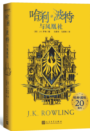
《哈利·波特与凤凰社》