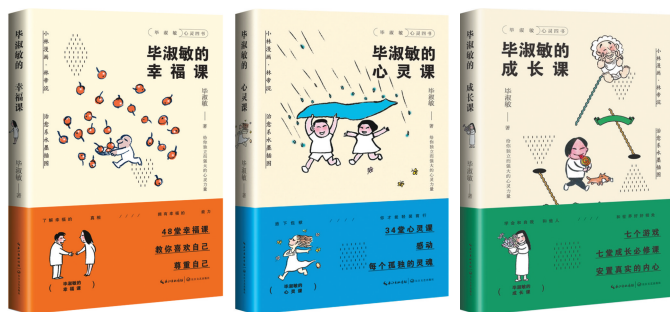
毕淑敏“心灵治愈书”系列。

疫情的存在让大众对社会心理问题越来越重视，不仅是《女心理师》，包括《脱口秀大会》《一年一度喜剧大赛》等涉及心理问题的节目无一例外也火了起来，心理健康题材已经变成文艺热门。对于社会大众来说，更是需要有普适性的读物来慰藉心灵。除了《女心理师》原著外，毕淑敏还推出“心灵治愈书”系列，分为《毕淑敏的幸福课》《毕淑敏的心灵课》《毕淑敏的成长课》三本书，从实际心理问题出发，通过幸福、心灵、成长三个角度深挖人生的真相。