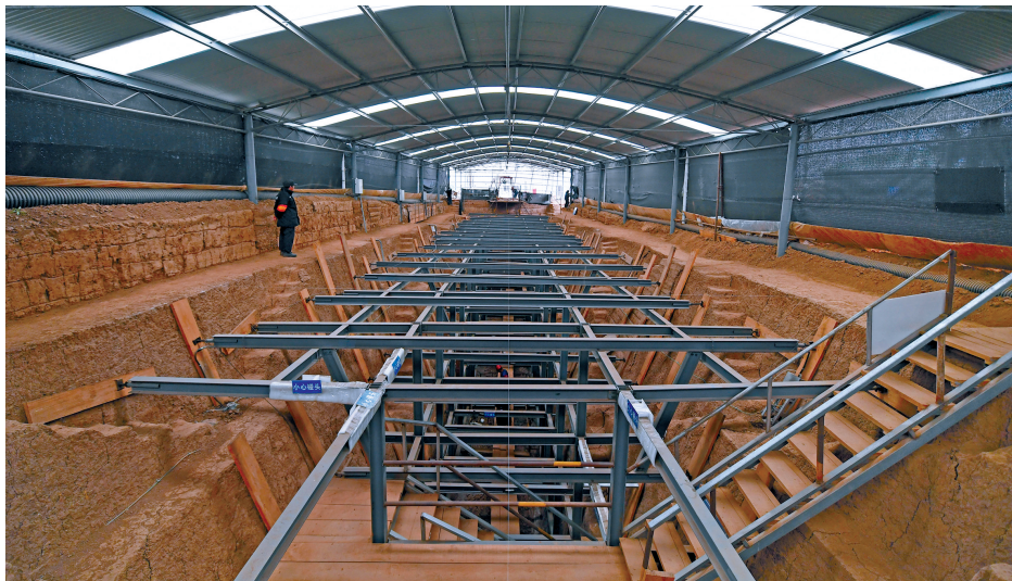
12月16日拍摄的江村大墓外藏坑。