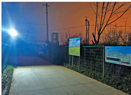
江村大墓外围。

数百年来被认为是汉文帝霸陵的“凤凰嘴”，并不是这位帝王的真正归宿之所。陕西省文物部门14日发布最新考古结果：开创了“文景之治”的汉文帝，其陵墓位置、规模已确认，并从霸陵周边的外藏坑及陪葬墓中，出土了大量金银器、陶俑、铜印等珍贵文物。“汉文帝霸陵”之谜被揭开面纱。