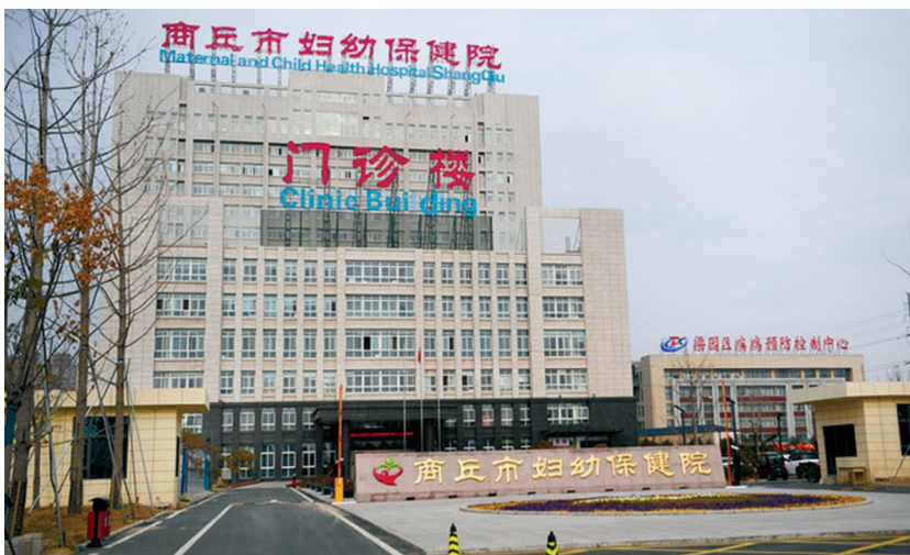
2021年12月9日拍摄的商丘市妇幼保健院。

记者了解到,商丘市梁园区卫生局(现为商丘市梁园区卫健委)曾于2011年2月7日发布一份红头文件,称该局接到被盗事件报告后立即启动了问责机制,通过调查发现:商丘市妇幼保健院安全保卫措施存在薄弱环节,领导重视程度不够,工作人员工作不认真,医院内部管理有待进一步加强。处理情况包括对该院院长、副院长等人进行通报批评,要求写出深刻书面检查,免去该院保健科科长职务,