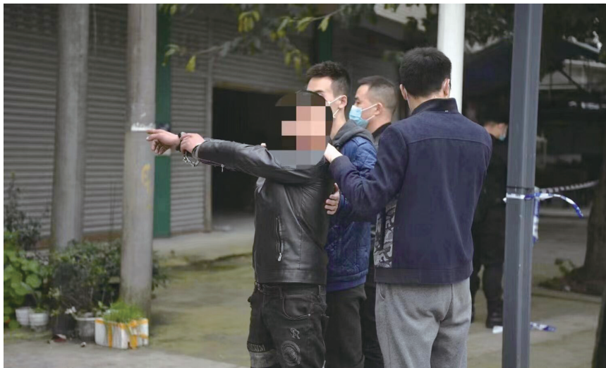
民警带着犯罪嫌疑人指认现场。

2020年公安部开展命案积案攻坚行动后，该案被列为部级督办案件。同年12月24日，公安部命案积案攻坚督导组主要负责人率队督导该案，侦查工作持续加码。