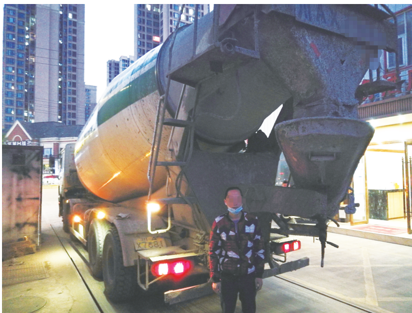
被查获的严重超载两辆水泥罐车之一及违法嫌疑人。