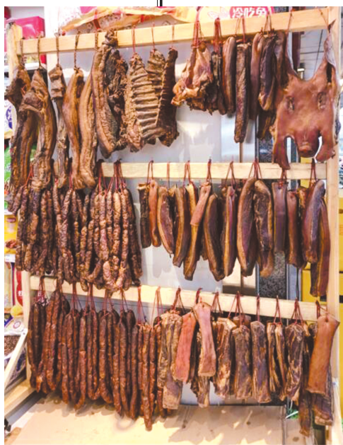
冬天又到腌腊肉、灌香肠的时节。

同仲冬一起到来的，还有二十四节气之中的大雪和冬至。特别是冬至，在古人看来，可是一个十分重要的节气。古代民间还有“冬至大如年”的讲法，冬至更是“四时八节”之一。此时，也是冬日进补的好时节，可千万不要轻易放过啦。