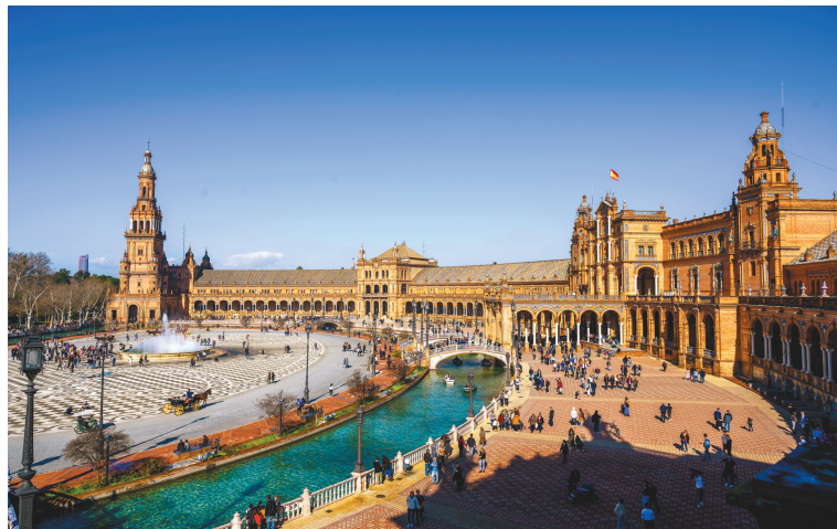
西班牙塞维利亚风光。

罗西尼有个习惯，经常把自己其他歌剧里的咏叹调、合唱曲挪用到新歌剧里来。《塞维利亚的理发师》就用了《结婚证书》里的多首咏叹调和合唱曲。他在给另一位作家的一封信中坦言他的创作方法：“我的《塞维利亚的理发师》写得更好。我没有为它创作序曲，而是挑选了一段我原本打算用在另一部名叫《伊丽莎白》的半严肃歌剧中的音乐，以它作《塞维利亚的理发师》的序曲。嘿，没想到观众对它还完全满意。”