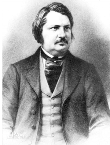
法国作家巴尔扎克

1778年博马舍写出“费加罗三部曲”中的第二部《费加罗的婚礼》，对贵族阶层和官僚机构的讽刺揭露更加尖锐，路易十六亲自下令禁演此剧。博马舍为此争斗了6年。1784年该剧终于上演，连演100余场，使博马舍的声誉达到顶峰。