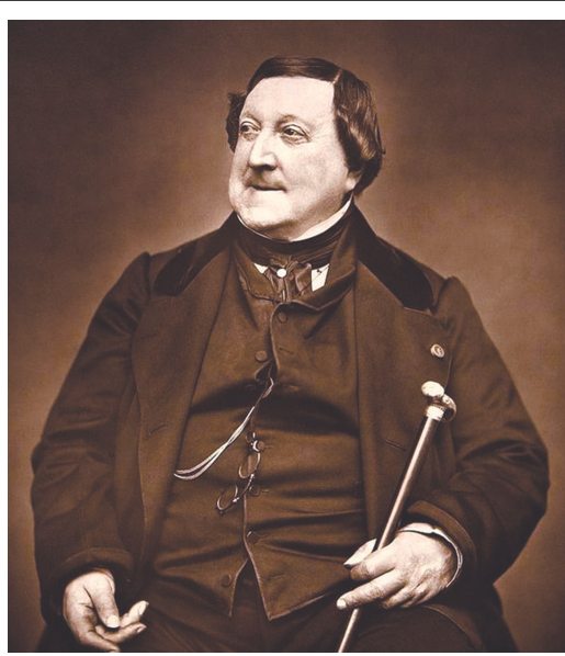
意大利作曲家罗西尼

不过，罗西尼却不以为意，他对自己的歌剧充满信心。果然，后面的演出效果越来越好，受到观众的热捧，愈演愈盛，很快成为欧洲各大剧院常演剧目。