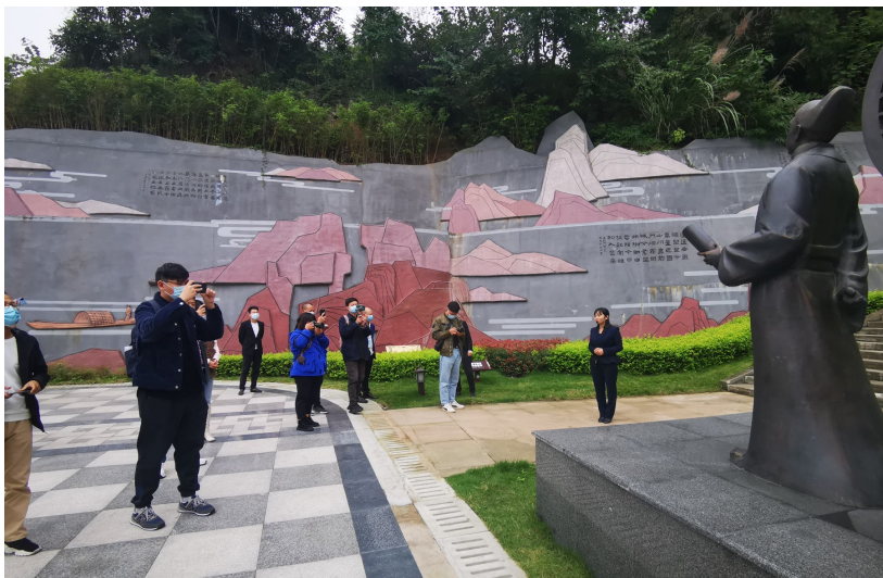
10月15日，巴蜀文化旅游走廊“百城行”大型采访活动来到射洪。媒体记者与青蕉拍客打卡子昂故里文化旅游区。（资料图）