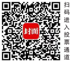
扫码进入投票通道

本次评选分为推荐、初选、线上投票、专家评审4个阶段。线上投票将持续至11月下旬,随后将进入专家评审环节。专家评审将从文化内涵、旅游标识、艺术审美、创新创造、社会影响等五个维度进行综合考量,对入围新地标进行综合评分。其中,专家评分占最终评分的70%,另外30%则来自公众投票。两项分数相加,最终评选出2021年成渝文旅新地标的主榜单和子榜单。