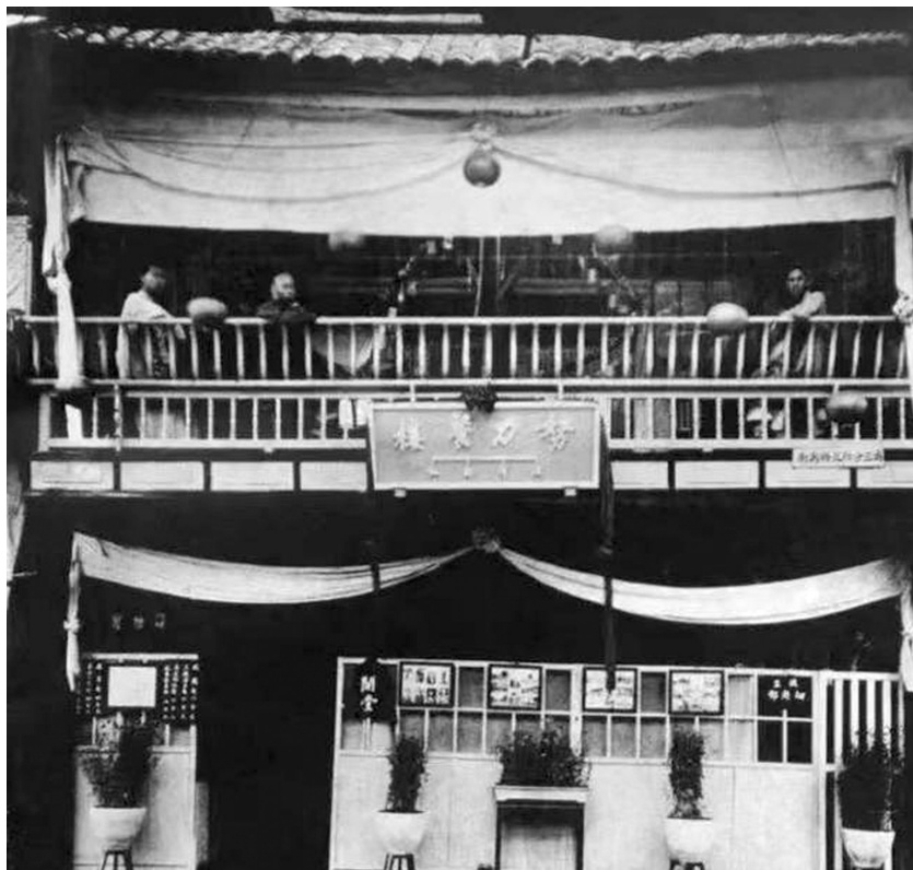
努力餐楼资料图。