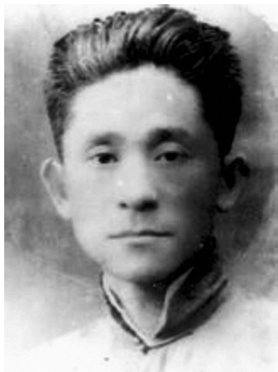
车耀先烈士资料图。