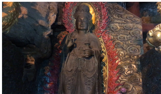
▲绵阳碧水寺摩崖造像。