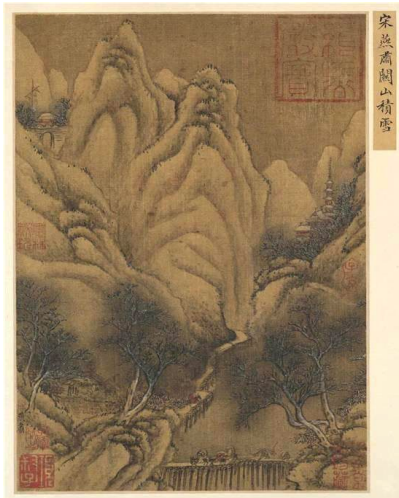
北宋燕肃《关山积雪图》。