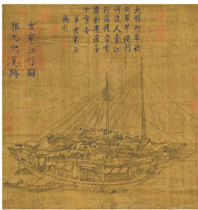
五代郭忠恕《雪霁江行图》。

冬日虽看似寒冷漫长，但在节气之中，也生出不少有趣快活的习俗来。比如，古人强调的“冬补”，就始于节气立冬，其是中国传统的饮食习俗。古人认为，冬天是对身体“进补”的大好时节，且天气寒冷需进补以度严冬。于是，吃汤圆、豆腐，包饺子，喝羊肉汤……美食开始轮番登场，用美味慰藉因冷气而发抖的身体。