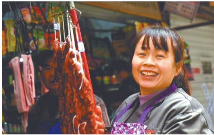
又到一年中做腊肉香肠的时节。

过完秋天的最后一个节气霜降，进入公历11月，就迎来了冬季的第一个节气——立冬。要知道，立冬是季节类节气，表示自此进入了冬季。随后，节气小雪也会随之而来，表明天气将朝着寒冷再进一步。