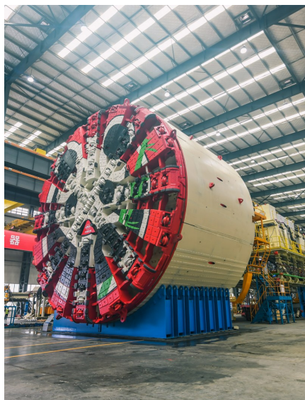
大熊猫涂装占据盾构机刀盘C位。

“锦绣号”总长135米,总重3000吨,约是长征五号运载火箭体积的15倍,预计平均每天可掘进9米。这台盾构机刀盘涂装极具四川特色——一只怀抱嫩竹的大熊猫占据C位,呆萌可爱,被网友称为“最萌大国重器”。