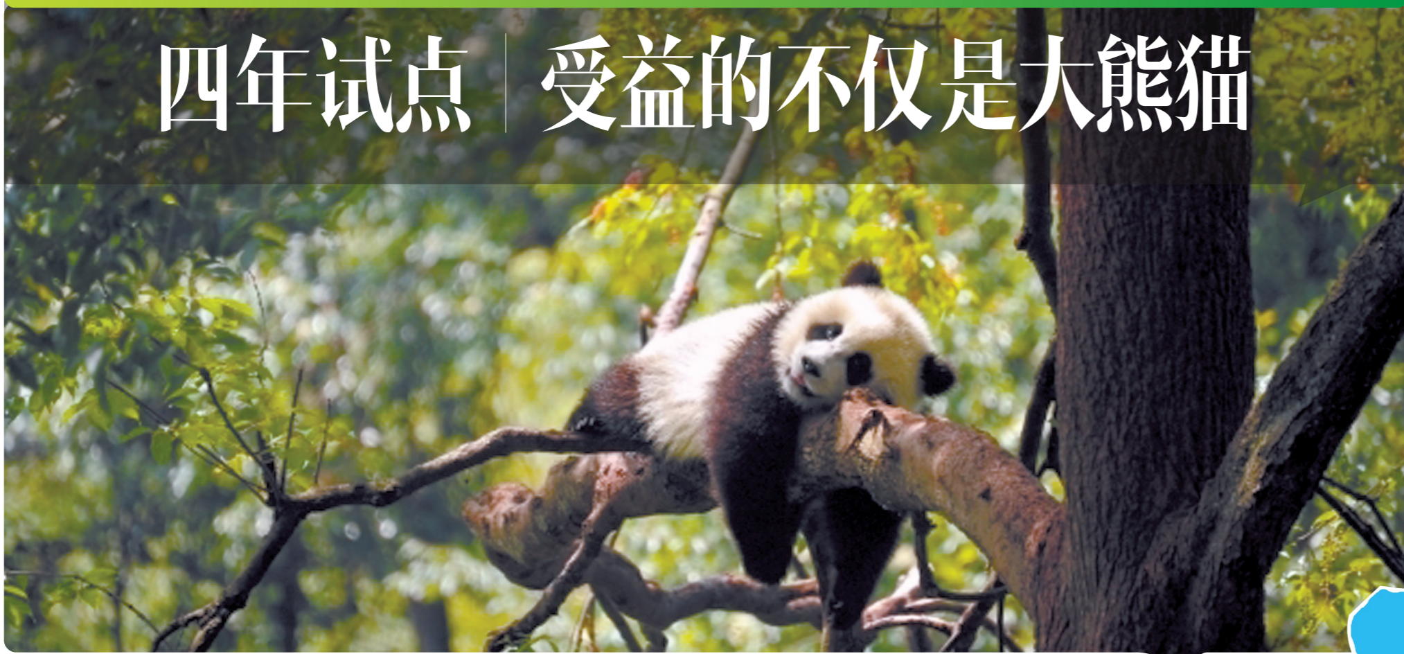
大熊猫国家公园卧龙片区的大熊猫。

10月12日,在昆明举行的《生物多样性公约》第十五次缔约方大会上,中国向全世界宣布:大熊猫国家公园正式设立!从此,大熊猫国家公园建设迈入新阶段。上世纪60年代至今,我国先后建立大熊猫自然保护区67个,其中四川46个。然而,保护管理机构政出多门、设置分散,规划范围交叉重叠、多头管理等问题,严重制约了大熊猫保护管理水平的提升。2017年1月,大熊猫国家公园体制试点工作全面启动。这是一场由国家主导、关于大熊猫及其栖息地最高级别的保护,试点区域地跨四川、陕西、甘肃3省。4年试点结束后,“滚滚们”得到的不仅仅是一个家。