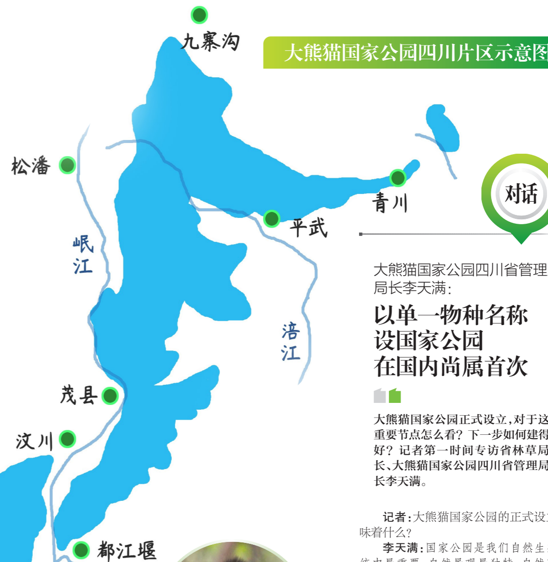
大熊猫国家公园四川片区示意图