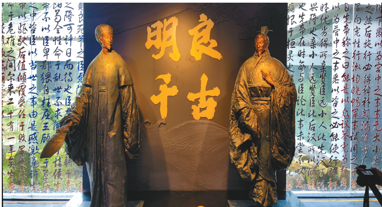
《明良千古——刘备与诸葛亮君臣合展》展厅。

该展览为武侯祠的常设展览，从初创、设计到实施，历时8年，汇集了武侯祠博物馆和四川博物院、湖北襄阳市博物馆、凉山彝族自治州博物馆、成都永陵博物馆、成都市文物考古研究院等多家单位的200余件(套)精品文物，力图通过以文物为核心的讲述，勾勒出那个英雄辈出的时代，以及刘备、诸葛亮两位历史文化名人的交汇轨迹和旷世传奇。