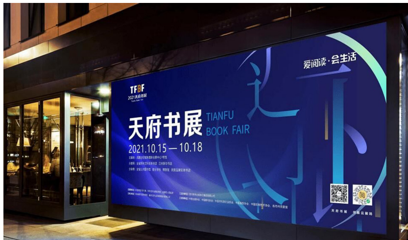
2021天府书展将于10月15日至18日举行。

除了发布新书,天府书展也是业界之间、业界与大众沟通的高效平台。在本届天府书展期间,还将举办诸多重大文化活动,比如10月15日下午在成都市新津区中国天府农业博览园举办的“2021新时代乡村阅读盛典”,农民喜爱的100种图书揭幕仪式暨颁奖典礼,2021新时代乡村阅读盛典,“一带一路”出版交流会,第二届全民阅读研究年会——“推进覆盖城乡的全民阅读推广服务体系研究”主题演讲,第二届全民阅读研究年会——“推进覆盖城乡的全民阅读推广服务体系研究”学术交流,第三届“全民阅读·全国书店之选”十佳作品发布会,2021—2030古籍出版规划年会,“中小学教科书中的党史印