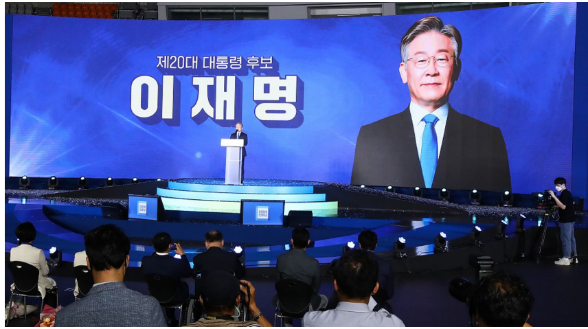
京畿道知事李在明赢得党内预选。

不见经传的“火天大有资产管理公司”被选为这一土地开发项目的民间合作伙伴，经由“私订合同”而非竞标拿下五个地块，且拿地价格只有其他开发商中标价格的65%左右。按照韩联社的说法，这家资产管理企业及其附属企业获得上千倍于投资的利润。