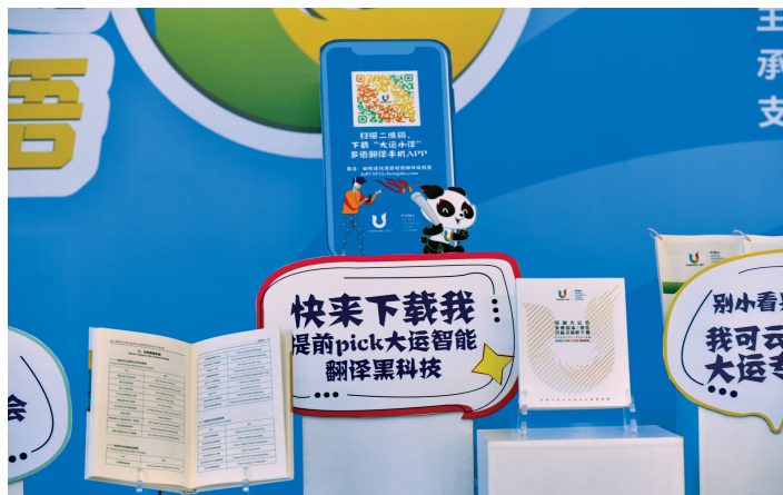
大运智能翻译黑科技上线。

与此同时，外事联络部为成都大运会“量身定制”的“大运小译”多语手机智能翻译软件扩大测试版亮相，这也是世界大学生运动会历史上首次推出的即时语言服务软件。“大运小译”APP除了包含传统的文本、语音、拍照等翻译功能以外，更是定制了急救包、大运术语、工作语言包等大运会专用功能。其中，急救包是为境外参会客户群提供的10个对话场景的应急100句，工作语言包是各工作部根据赛时可能遇到的各类服务场景梳理的对话，旨在为赛时人工翻译服务做好补充，为广大市民、参会客户群和工作人员带来更快捷、更安全的沟通渠道。