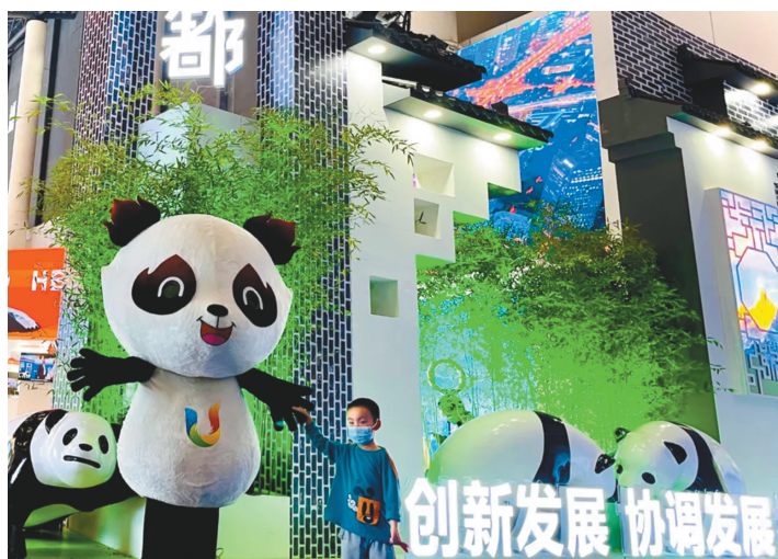
成都因运动而充满活力。