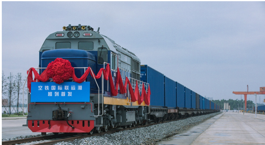
9月27日上午10点30分,成都(双流)空铁国际联运港首趟国际班列正式出发。

为何聚焦南向?一组数据可以说明:今年上半年,成都货物贸易进出口总值3679.5亿元,其中对东盟进出口735.8亿,