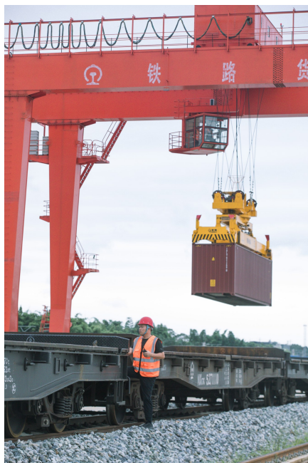
工作人员将集装箱装上国际列车。

占比20%。东盟已成为成都第三大贸易伙伴,仅次于美国与欧盟。南亚、东南亚拥有23亿人口的巨大市场,能拓展四川开放型经济发展新空间。