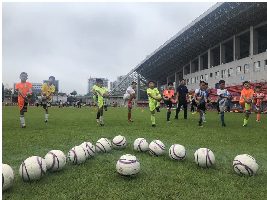
体彩公益金助力四川竞技体育发展。

2020年,四川全省各级体育行政部门在分配的体育彩票公益金中共安排支出7亿多元,用在竞技体育支出约3.2亿元,占总数的四成。其中用于举办或承办区县级以上体育赛事3569万元;用于改善训练比赛场地设施条件8607.75万元;用于资助体育后备人才培养约1.17亿元;用于支持运动队参加国际国内运动会6085.60万元;用于补充运动员保