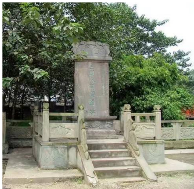
青白江区弥牟镇“旱八阵”是诸葛亮八阵图较著名的遗址之一。

驱车从青白江区教育街出发,沿着华金大道一直往西,不过几里路就到了弥牟镇。左拐上“八阵大道”,前行约500米,右手边就会看见一个新建的古风式牌坊“八阵巷”。下车漫步,进入八阵巷,首先映入眼帘的,就是“八阵赋”,细读一番,就能对八阵图的历史沿革有