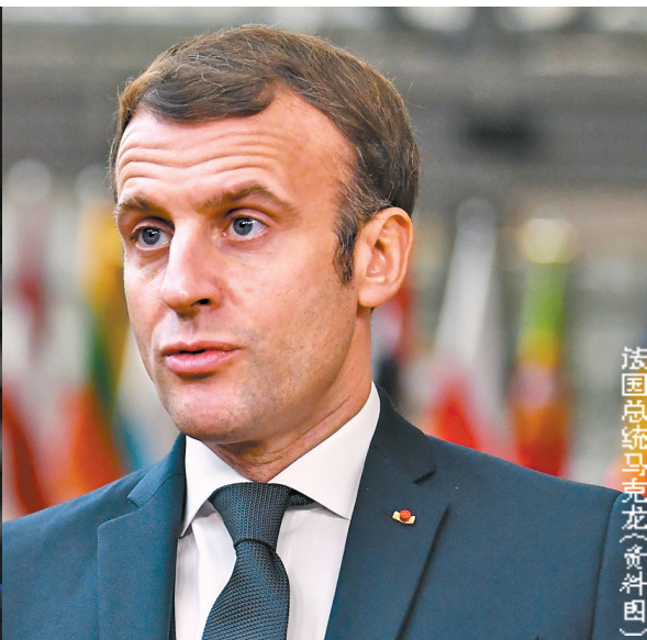
法国总统马克龙(资料图)