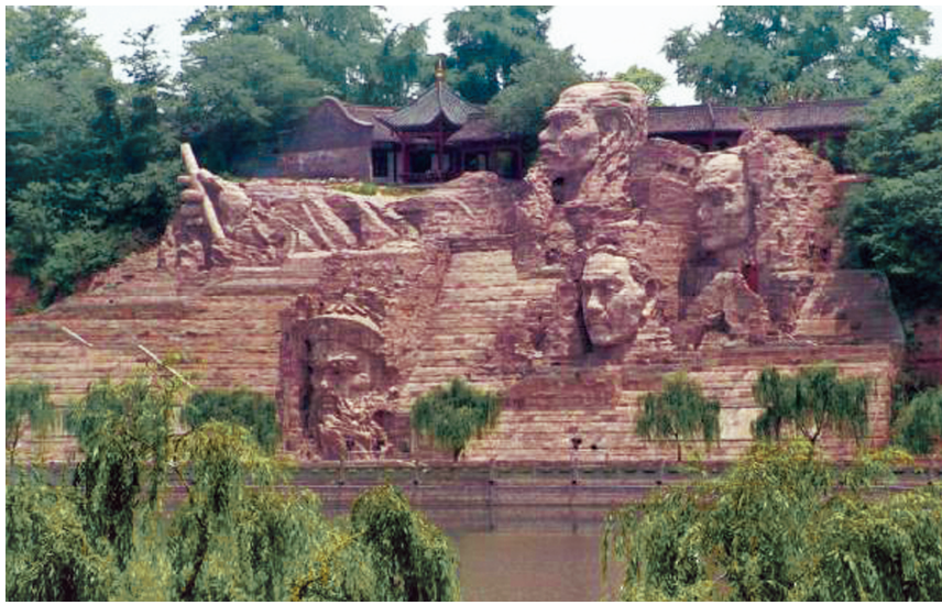
李调元纪念馆

“志，记也”，《成都街巷志》有着丰富的历史与地理知识，通过成都的一条条街巷，来介绍成都的历史文化。袁庭