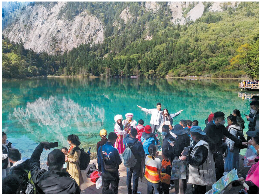
中秋小长假，九寨沟景区游人如织。

在“三九大”文旅品牌引领下，全省15个5A级旅游景区累计接待游客51.23万人次，实现门票收入2084.3万元，分别占全省A级旅游景区的6.73%和30.06%。