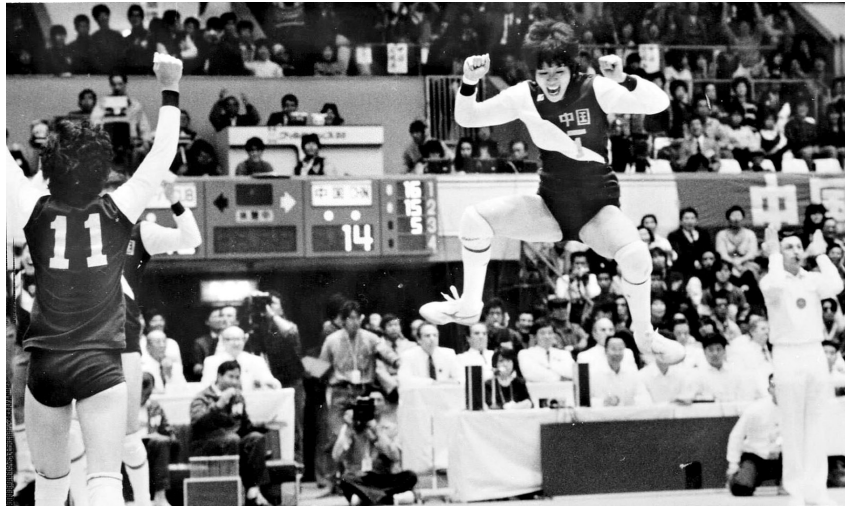
1985年11月17日,中国队以3比1战胜古巴队后,郎平高高跳起庆祝。

老女排队长孙晋芳回顾女排奋斗历程时表示,引导更多年轻人敢于担当的责任感,为祖国尽一份力,就是对女排精神最好的传承。