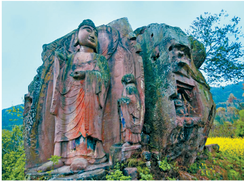
冒水村《世尊讲法图》造像。

走近观看《世尊讲法图》,主尊为世尊释迦牟尼,旁立弟子迦叶。世尊高5.1米,赤脚站在0.93米高的莲台之上,