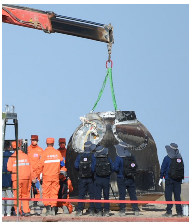
9月17日，工作人员在对返回舱进行处置。

东风着陆场位于酒泉卫星发射中心东部，地处巴丹吉林沙漠和戈壁带，有戈壁、沙漠、山地、盐碱地、梭梭