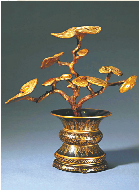
黑漆描金蕉叶纹灵芝盆。