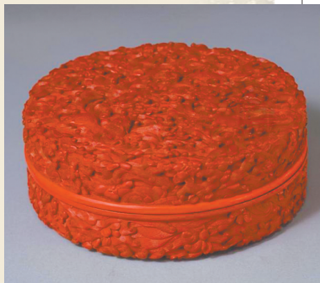
乾隆款剔红海兽纹圆盒。