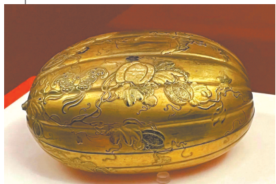
金漆瓜瓞纹瓜式盒。